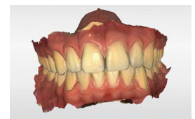
【口腔内スキャンイメージ】

口腔内スキャナーを使用してデジタル化を進めることは作業工程が簡略化され、精度も向上していくことが期待できます。