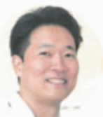
医療法人緑風会理事長 三宅医院院長