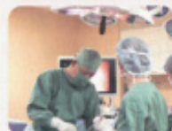
当院の婦人科の全身麻酔手術は、麻酔科医師が担当しております。